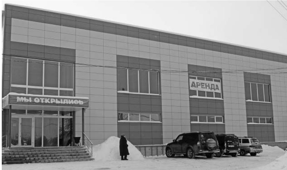
Новый современный магазин, открывшийся в п.Думиничи.