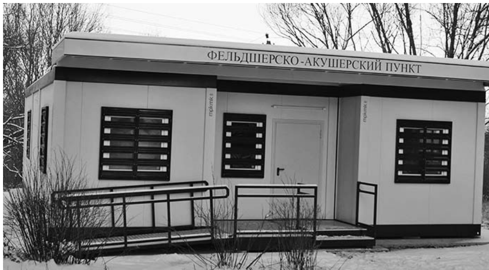
Модульный ФАП в с.Брынь.

В прошлом году мы поставили задачу - наладить работу спорткомплекса так, чтобы здесь могли найти занятия по душе и дети, и молодежь, и взрослые. Во многом эта цель достигнута. Но работа над тем, как привлечь к занятиям физической культурой как можно