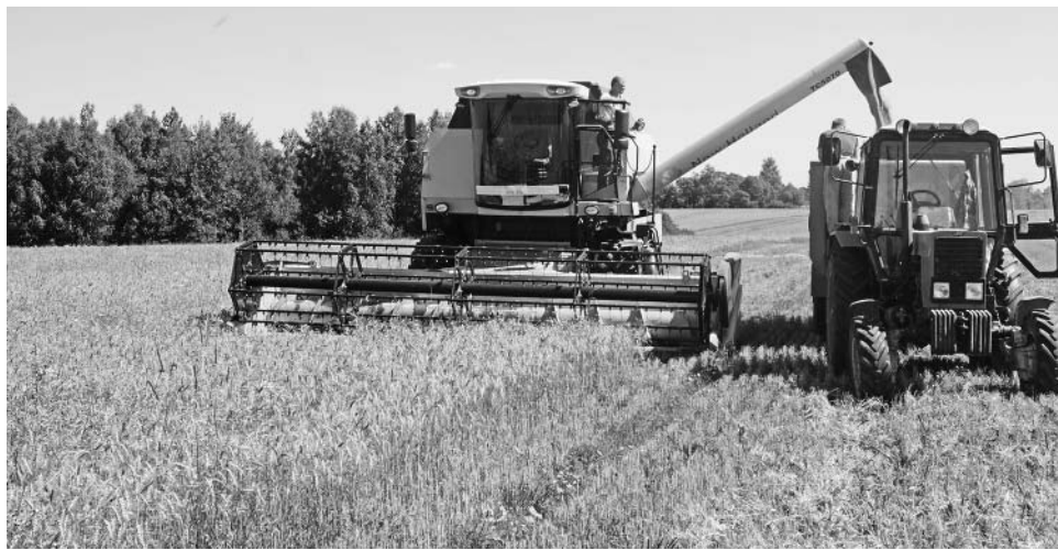
Хороший урожай зерновых выращен в ООО «Вишневый сад».

И, безусловно, главным праздником и главным событием года был, есть и будет День Победы нашего народа в Великой Отечественной войне.